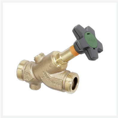
Easytop-Schrägsitzventil (Freistromventil) Modell 2237.3 Artikel 756 956