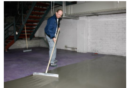
Mit PCI Periplan® Multi läßt sich ein schnell belastbarer Bodenausgleich einfach herstellen.